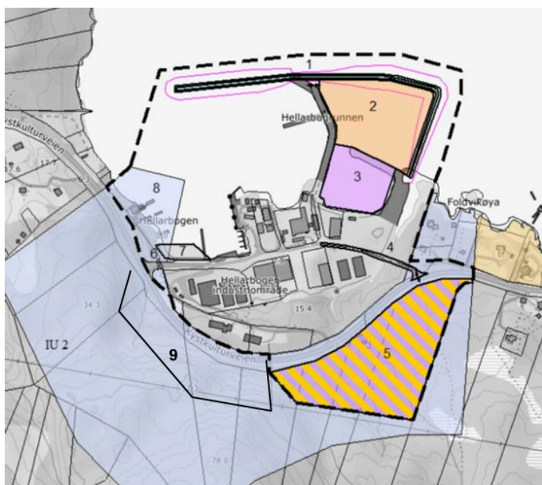
Figur 6: Tiltaksområdet.